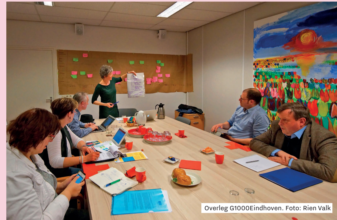
Overleg G1000Eindhoven.

Dat G1000 werkt, is al gebleken in steden zoals in Uden, Veghel en Amsterdam. Leyla: 'Amersfoort